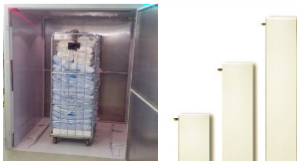
Terminal Táctil pc, etiquetadora, prensa térmica, etiquetas, cinta tinta, Lector Código Barras, Lector RFID Bluetooth, Portal RFID, Diferentes antenas RFID

Para mas información consúltenos al 977080607 ó visite la página www.softextarraco.com